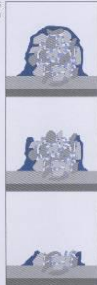
PEARL GRINDING Abschleifprozess